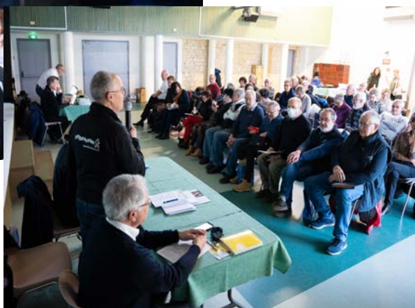
L'assemblée très attentive